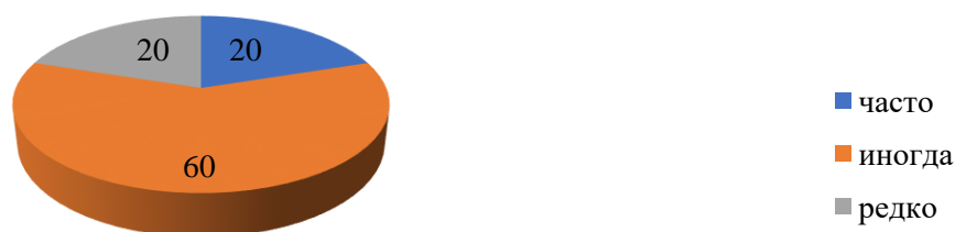
Рис. 1. Как часто подросток грубит?