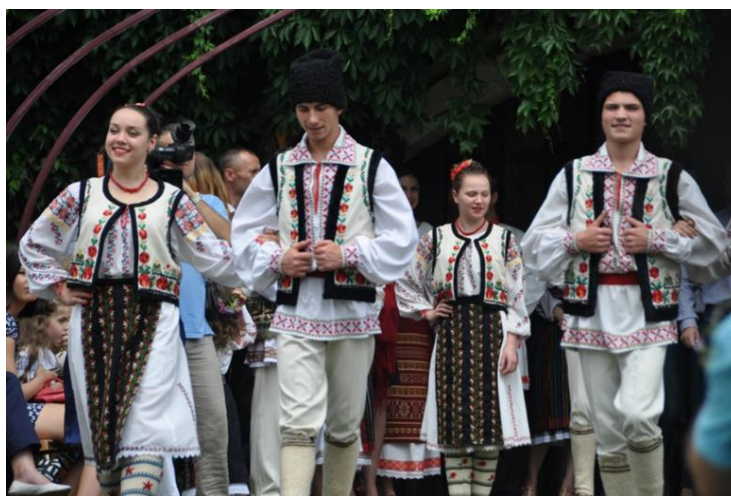
Fig.3 Secvență de la festivalul Ia Mania 2014. Portul popular moldovenesc

Costumul popular moldovenesc își găsește rădăcinile în portul strămoșilor noștri traci, geți și daci fiind supus unei continue evoluții și se aseamănă cu cel al popoarelor din Peninsula Balcanică, desigur cu deosebirile care constau în amănunte decorative și colorit. În decursul istoriei, structura și evoluția costumului nostru popular și-a păstrat nealterate caracteristicile esențiale (fig.3).