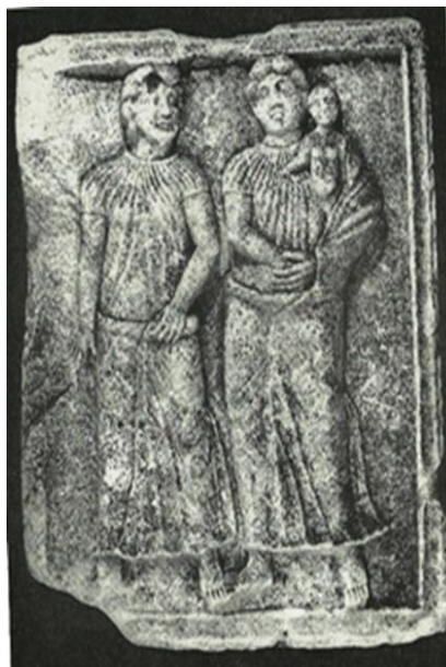
Fig.2 Femei dace pe metopele de la Adamclisi