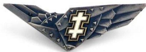
Рис. 2. Почесний знак Литовської військової авіації «Сталеві Крила»

В 1932 році була запроваджена відомча нагорода Міністерства охорони краю Литовської Республіки – Почесний знак Литовської військової авіації «Сталеві Крила». Даною відзнакою нагороджують військовослужбовців офіцерського та генеральського складу, які є льотчиками, що особливо відзначилися під час виконання завдань та операцій. В 1930-х та 1940-х роках відзнакою нагороджували військовослужбовців сержантського складу та військових льотчиків інших держав [2].