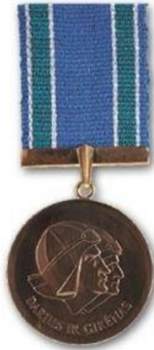
Рис. 1. Медаль Дарюса та Гіренаса

Металева колодка медалі обрамлена блакитною стрічкою та біло-бірюзовими смужками з обох боків [1].