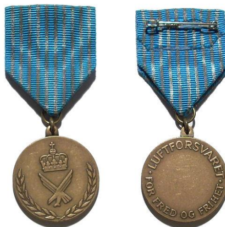
Рис. 4. Медаль Військово-повітряних сил «За вірну службу» (Норвегія)

В 1982 році була запроваджена відомча нагорода Військово-повітряних сил Королівства Норвегія – Медаль Військово-повітряних сил «За вірну службу». Медаллю нагороджуються військовослужбовці рядового складу Військово-повітряних сил Королівства Норвегія, які пройшли повну базову військову підготовку та звільнені в запас. Також відзначаються військовослужбовці офіцерського складу після здобуття військової освіти, які відслужили певний термін базової військової служби і в результаті звільнені в запас. За кожний черговий призов на військову перепідготовку на стрічку Медалі кріпиться п'ятикутна срібна зірка, але не більше трьох [4].