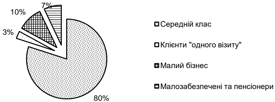
Рис. 1. Типові споживачі послуг ломбардів (побудовано за даними [3])

Аналогічно можна трактувати й структуру кредитів ломбардів за типом застави (рис. 2), в якій також вбачається «інвестиційна» ознака.